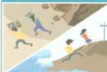
산이나 바다에 있을 경우

산사태, 절벽 붕괴에 주의하고 안전한 곳으로 대피합니다. 해안에서 지진해일 특보가 발령되면 높은 곳으로 이동합니다.