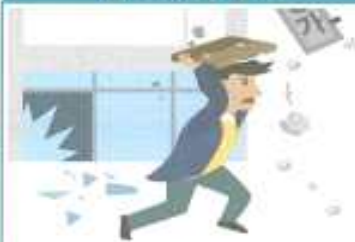
집밖에 있을 경우

떨어지는 물건에 대비하여 가방이나 손으로 머리를 보호하며, 건물과 거리를 두고 운동장이나 공원 등 넓은 공간으로 대피합니다.