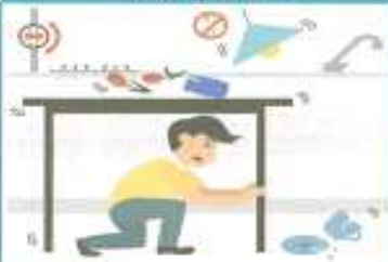
집안에 있을 경우

탁자 아래로 들어가 몸을 보호합니다. 흔들림이 멈추면 전기와 가스를 차단하고 문을 열어 출구를 확보한 후, 밖으로 나옵니다.