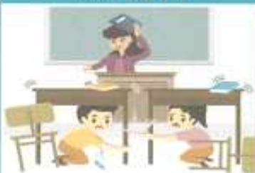
학교에 있을 경우

책상 아래로 들어가 책상 다리를 꼭 잡습니다. 흔들림이 멈추면 질서를 지키며 운동장으로 대피합니다.