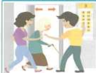
엘리베이터에 있을 경우

모든 층의 버튼을 눌러 가장 먼저 열리는 층에서 내린 후 계단을 이용합니다. ※ 지진 시 엘리베이터를 타면 안됩니다.