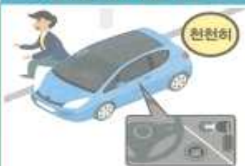
운전을 하고 있을 경우

비상등을 켜고 서서히 속도를 줄여 도로 오른쪽에 차를 세우고, 라디오의 정보를 잘 들으면서 키를 꽂아 두고 대피합니다.