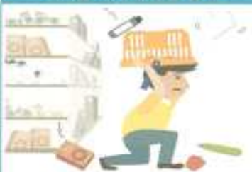
백화점, 마트에 있을 경우

진열장에서 떨어지는 물건으로부터 몸을 보호하고, 계단이나 기둥 근처로 가 있습니다. 흔들림이 멈추면 밖으로 대피합니다.