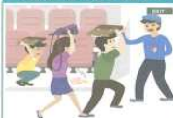
극장, 경기장에 등에 있을 경우

흔들림이 멈출 때까지 가방 등 소지품으로 몸을 보호하면서 자리에 있다가 안내에 따라 침착하게 대피합니다.