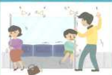
전철을 타고 있을 경우

손잡이나 기둥을 잡아 넘어지지 않도록 합니다. 전철이 멈추면 안내에 따라 행동합니다.