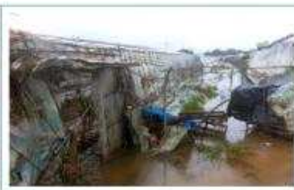
[일반 피해 하우스]