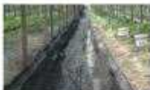
<정비 잘된 고령>