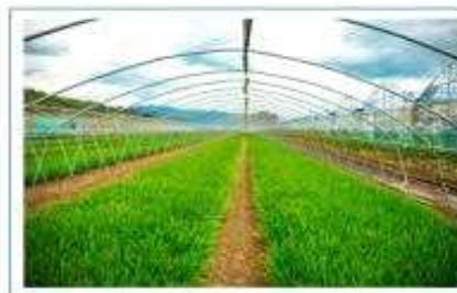
[비닐 사전 제거 하우스]