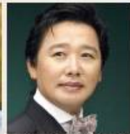
특별출연 가수 최성수