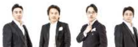
팜페라 그룹 라 클라세

이탈리아, 독일, 미국 등지에서 유학을 마치고 국내외 오페라 활동을 활발히 하고 있는 솔리스트들로 결성.