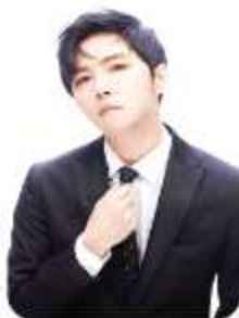
보컬리스트 정 동 하

록 그룹 부활의 객원 보컬 출신, 최근 불후의 명곡에서 최다 우승을 기록한 파워풀하면서도 감미로운 명품 보컬리스트.