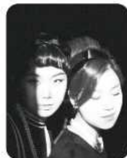
시간 여행 걸그룹 바버렛츠

5~60년대를 풍미한 보컬그룹 스타일을 현대적이고, 재치있게 풀어내는 여성듀오, 요즘 유행하는 레트로 감성과 잘 맞는 인기그룹.