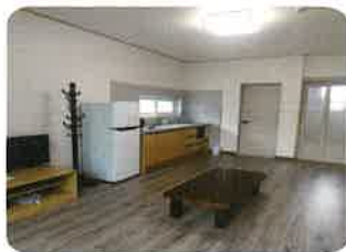
단기체험 실내 전경