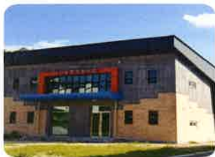
단기체험 외부 전경