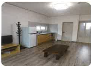
단기체험 실내 전경