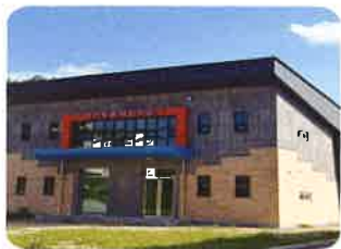
단기체험 외부 전경