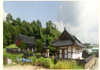
육제사 (성내면 육제리 473-3)

고용진(1850년),고석진(1856년) 고제만(1860년) 고순진(1863년),고예진(1875년) 고제천(1875년),고제남(1887년)