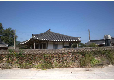
도동사(신림면 가평리 168-3) 최익현,고용진,고석진,고예진