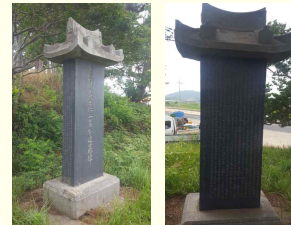
성내면 옥제리 388-16