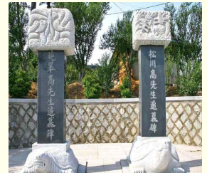
흥덕면 송암리 358