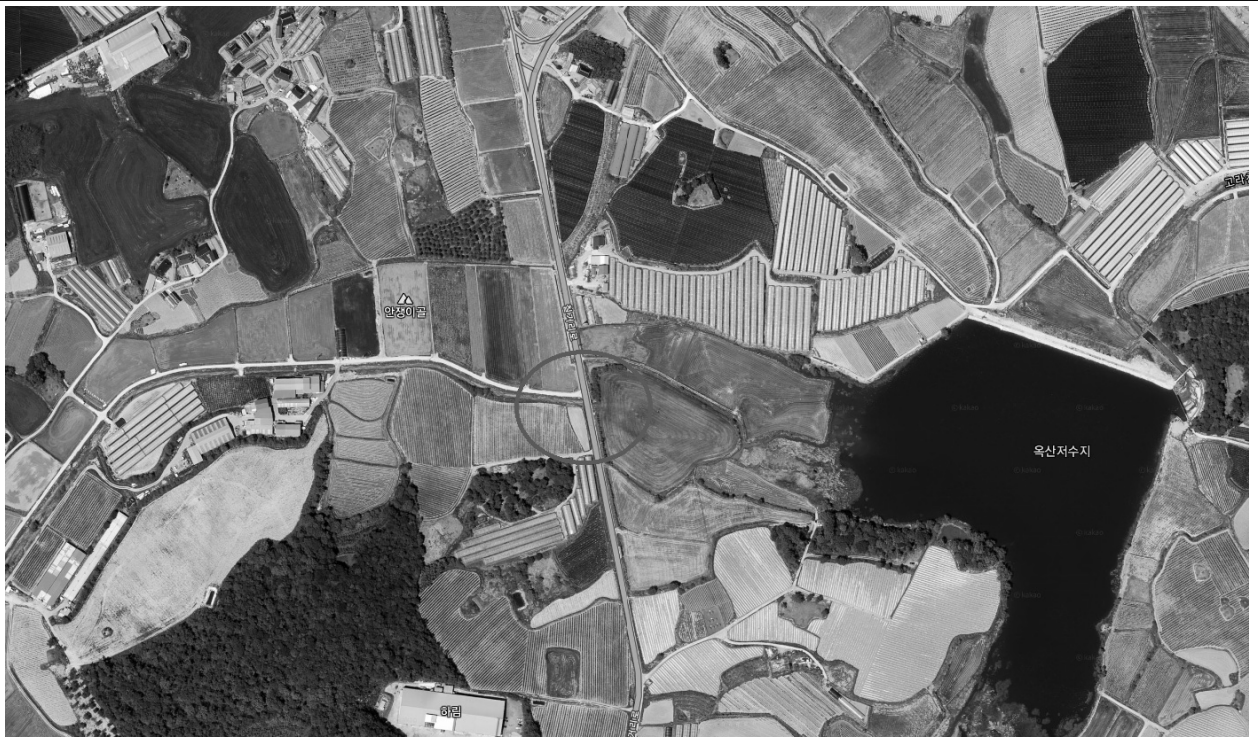
고창군 무장면 옥산리 1200번지