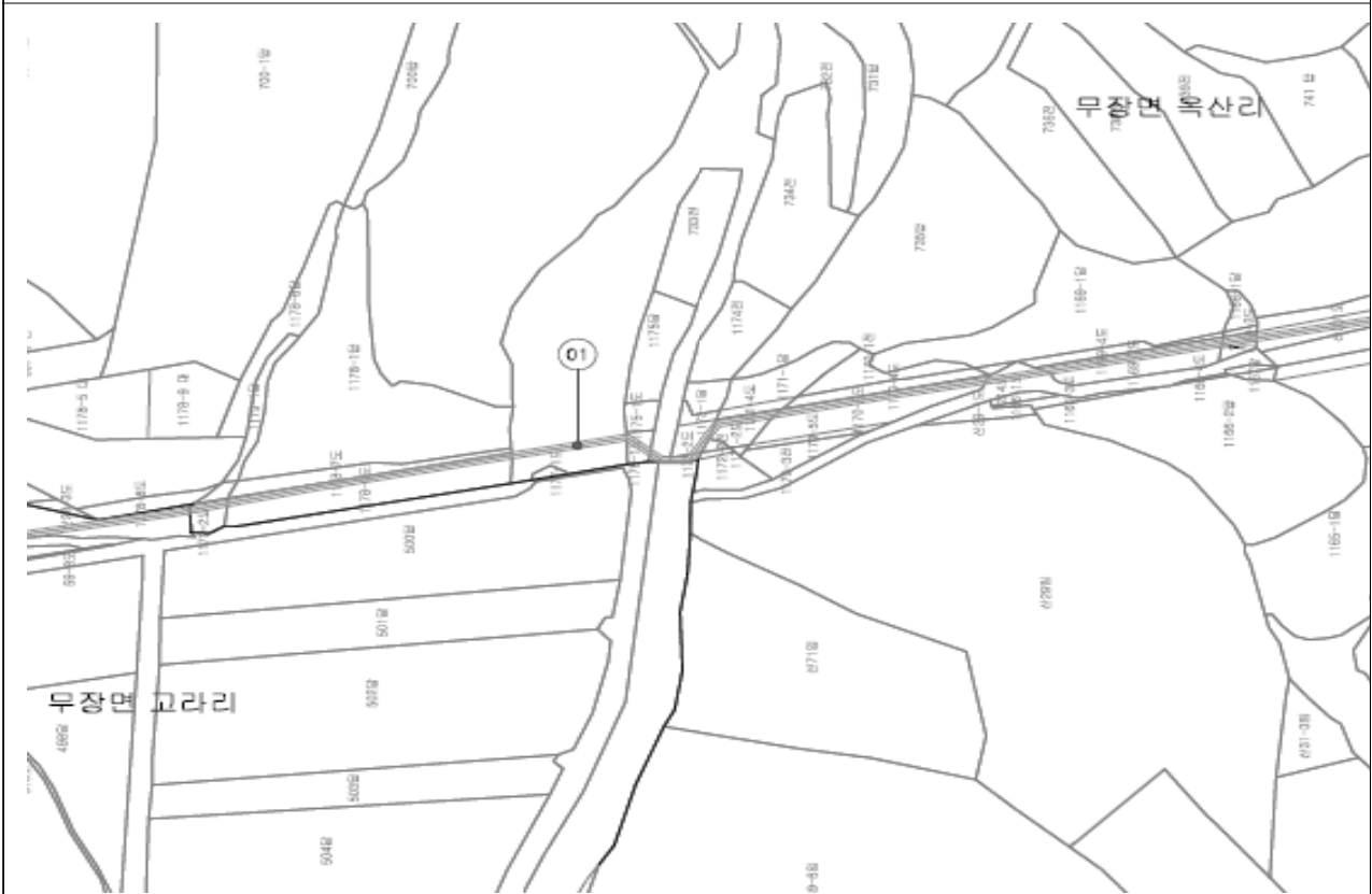
고창군 무장면 옥산리 1200번지