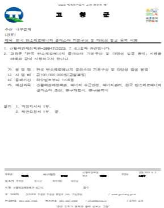
한국 탄소제로에너지 클러스터 기본구상 및 타당성 발굴 용역 시행(공문)