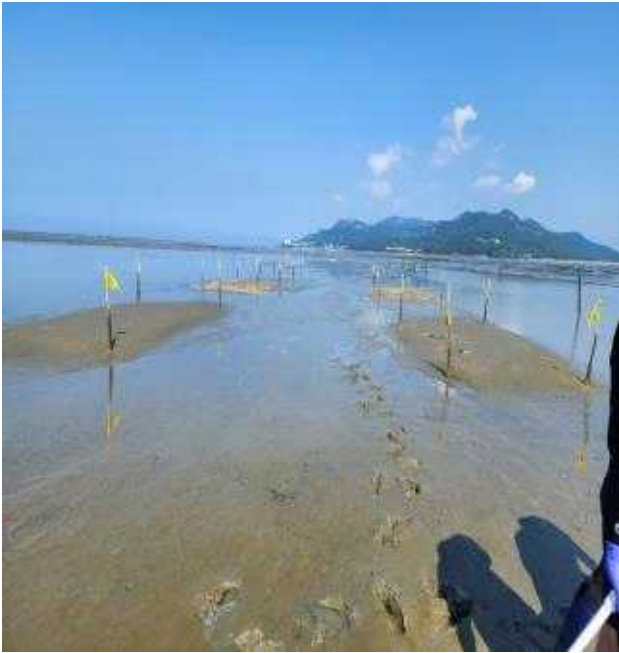
1차 테스트 어장 조성 사진