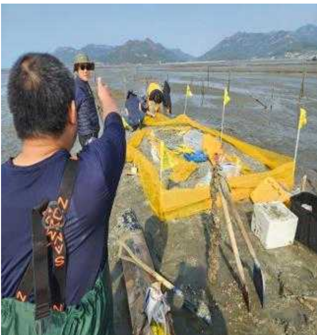
2차 테스트 어장 조성사진