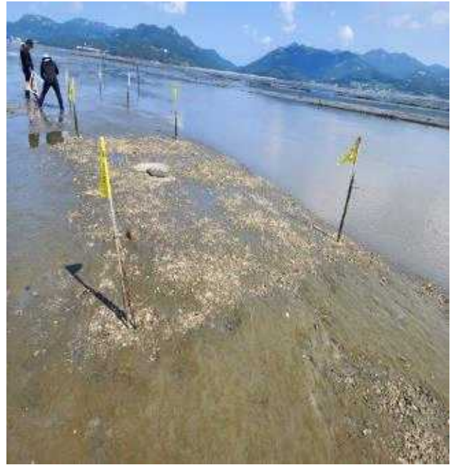
1차 테스트 어장 조성 사진