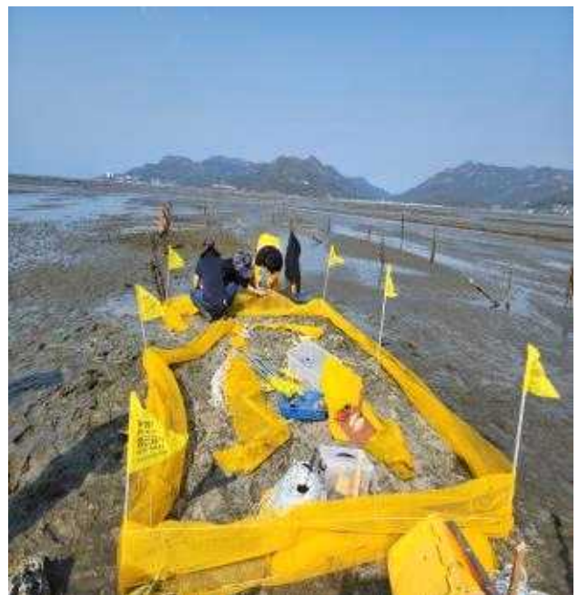
2차 테스트 어장 조성사진