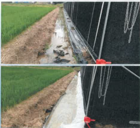
《시설 주변 배수로 정비》