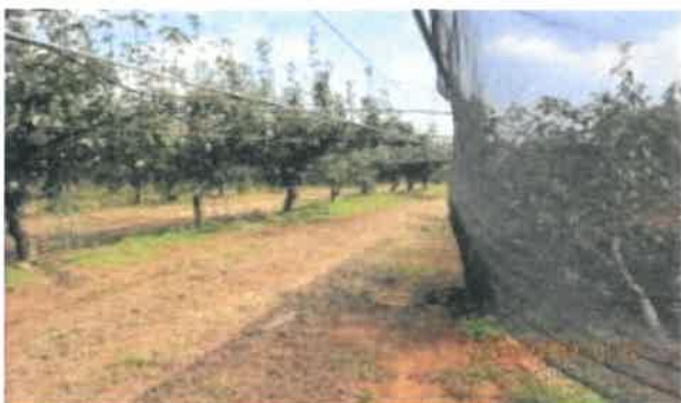
《과수원 방풍망 설치 전경》