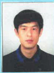
남 공 군 고창군수