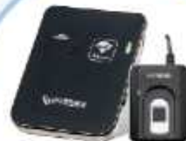
▲ 휴먼게이 H4/MC-200