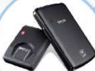
▲ 애플 아이폰 SE1-3803