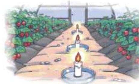
▲ 정전, 온풍기 고장시 양초·일코을 등 응급조치

응급대책 활용시 화재 위험성 및 산소부족으로 불이 꺼질 수 있으므로 세심한 관리 필요