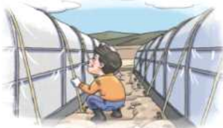
▲ 시설하우스 고정끈 설치 및 보강