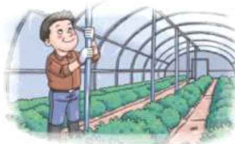
▲ 노후화된 시설 등은 보강지주 설치