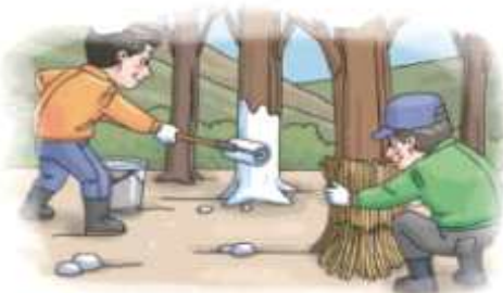
▲ 과수 주간부 벗질피복 또는 수성페인트 칠하기