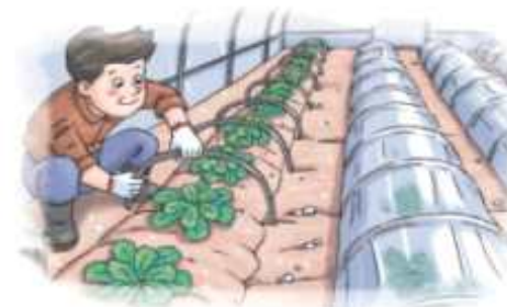
▲ 시설파손, 저온피해 우려시 소형터널 설치