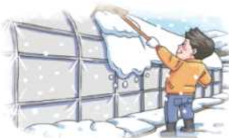
▲ 하우스 위 눈 쓸어 내기