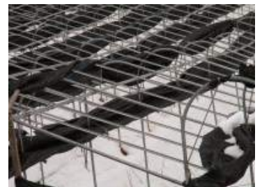
< 차광망 걷어둠 >