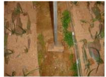
<보강지주 설치 전경> <도리와 보강지주의 연결> <바닥 지지판>