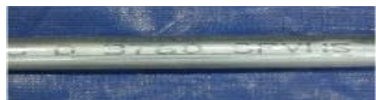
<내재해형 규격 파이프(SPVHS)>