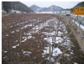
< 눈 털음 >