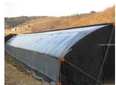
<차광망 위에 비닐씌움>