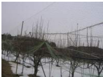
< 방조망 걷음 >