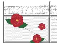
한국전쟁 전후 민간인 집단 희생(사망·상해·실종)

권위주의 통치 시까지 부당한 공권력에 의해 발생한 사망·상해·실종사건, 인권침해사건과 조작의혹사건