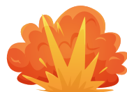
대한민국 적대세력에 의한 테러·인권유린과 폭력·학살·의문사