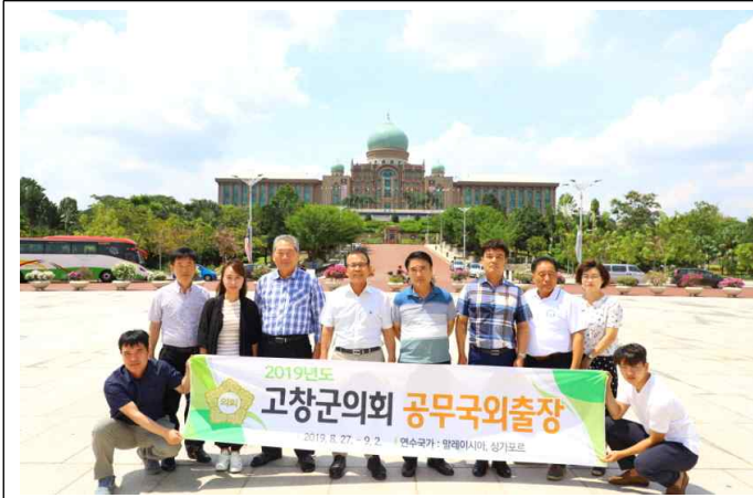
푸트라자야 총리관저 방문