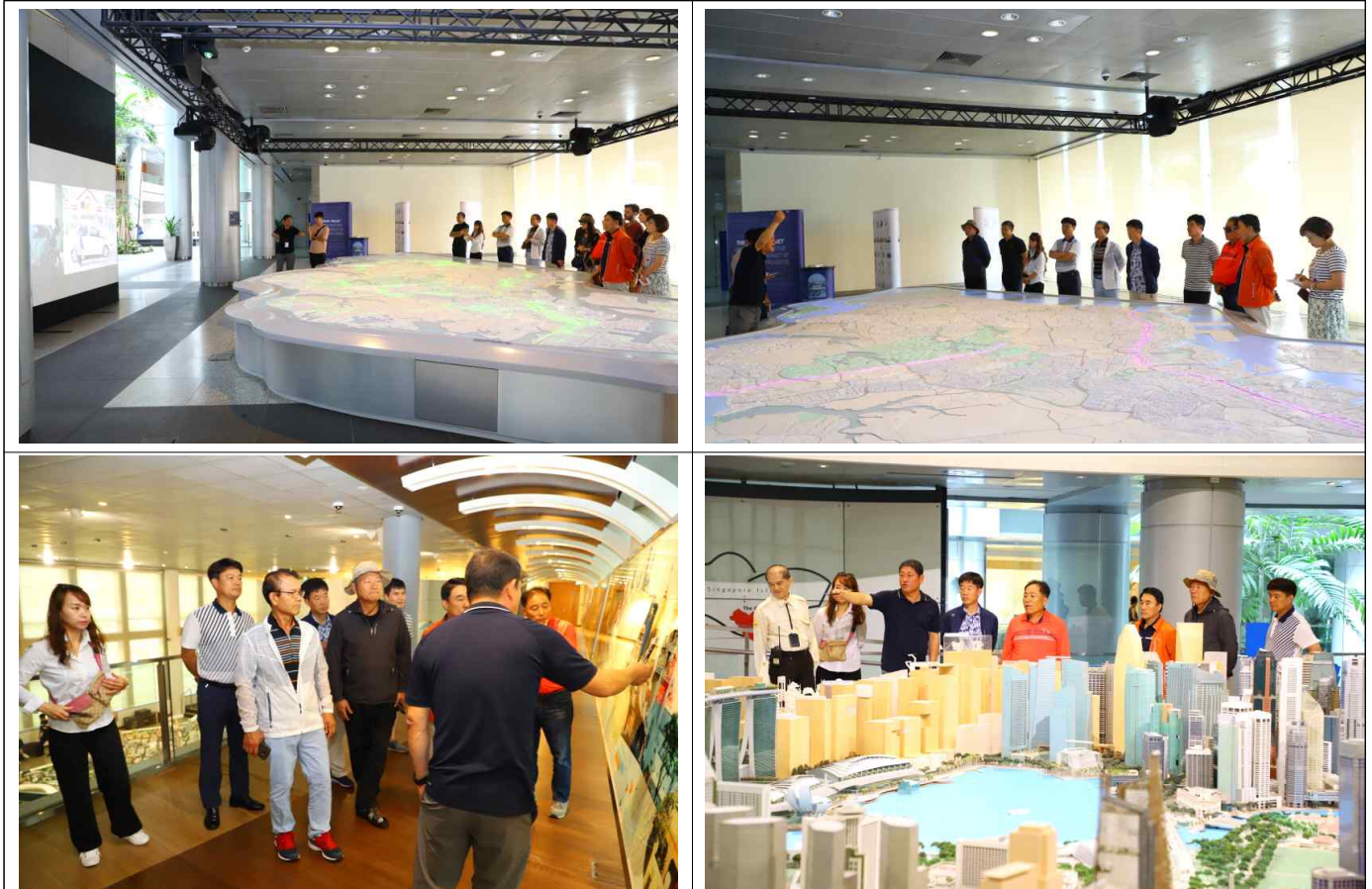
싱가포르 도시개발청(URA) 브리핑 청취