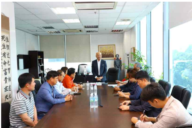
브리핑 청취 및 질의응답