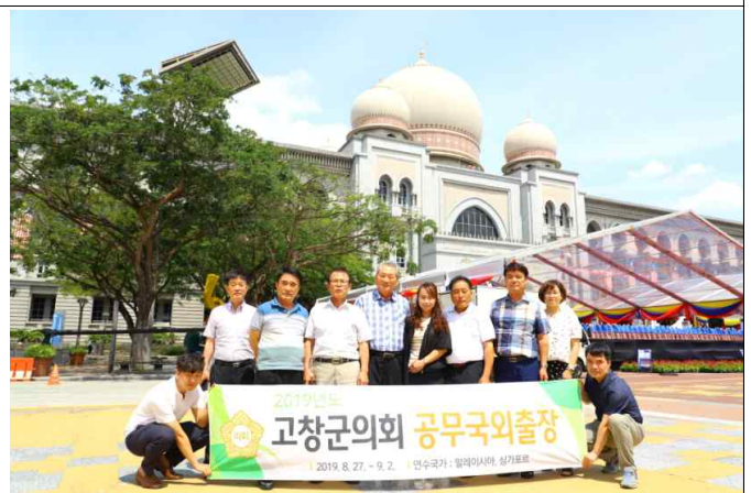
푸트라자야 연방법원 방문