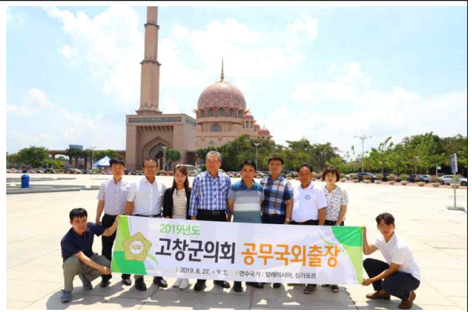
푸트라자야 이슬람사원(핑크모스크) 방문