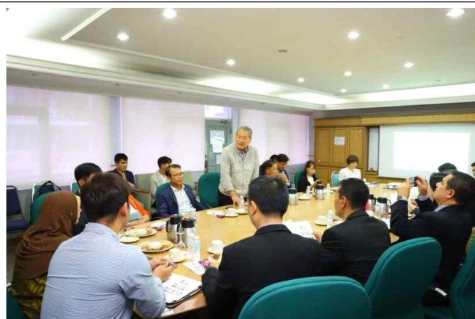
말레이시아 도시개발청 간담회