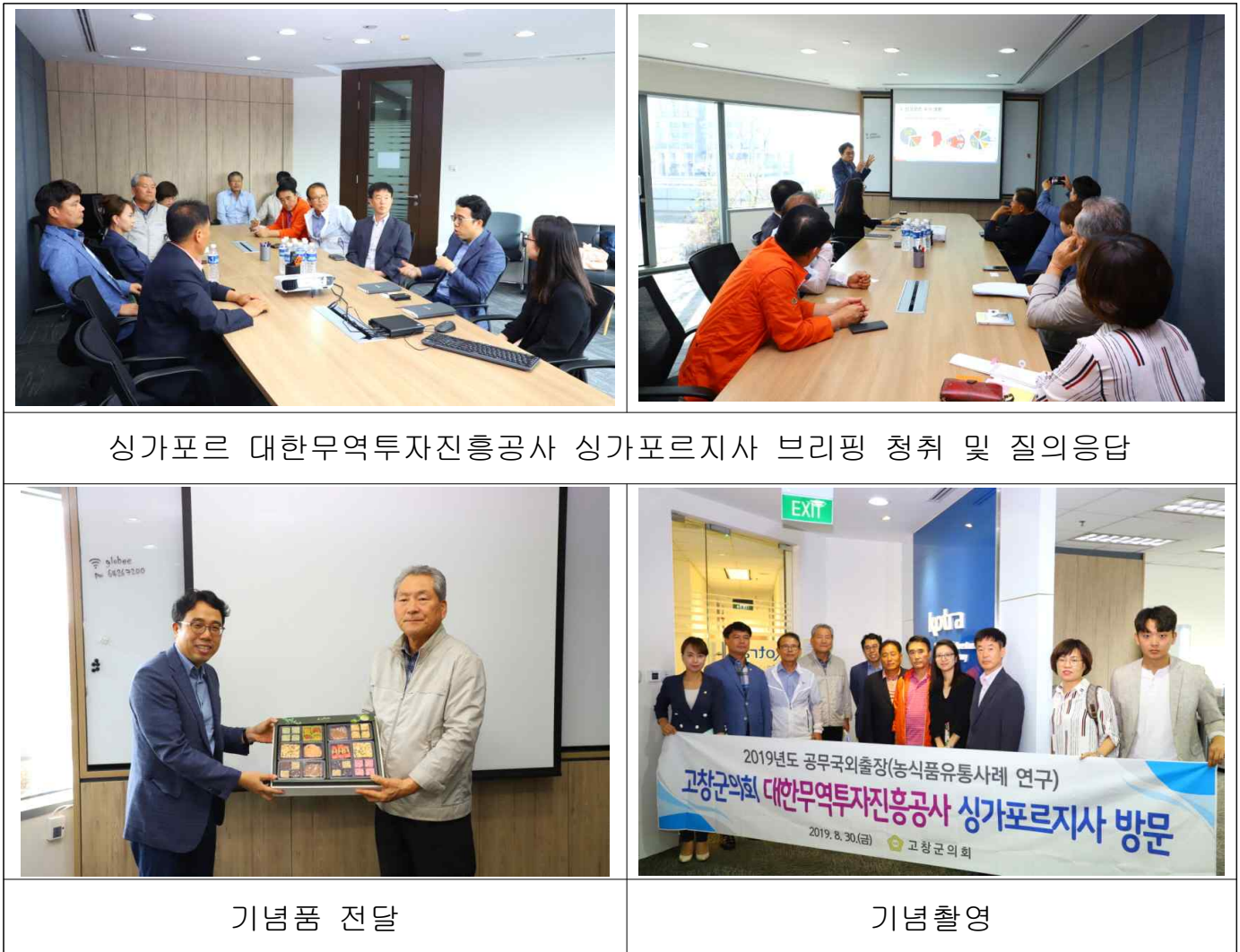
싱가포르 대한무역투자진흥공사 싱가포르지사 브리핑 청취 및 질의응답