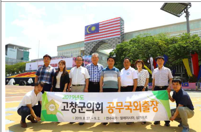
푸트라자야 관리청 방문