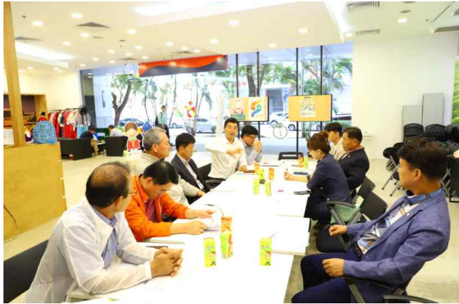
브리핑 청취 및 질의응답