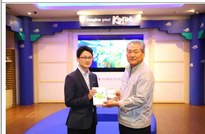
고창군 안내책자 전달