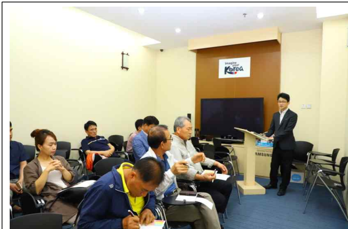
브리핑 청취 및 질의응답