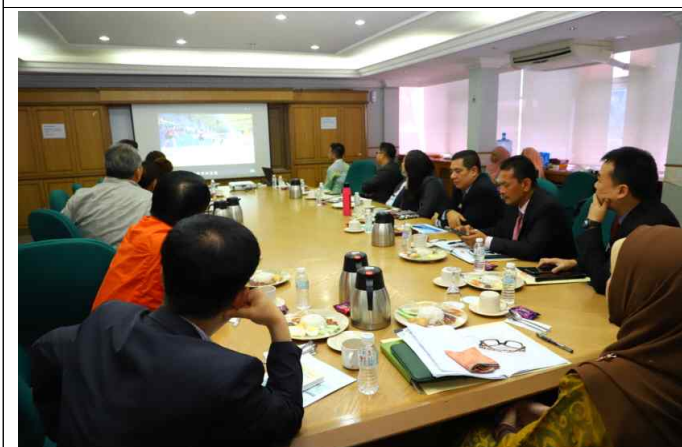
고창군 홍보영상 시청