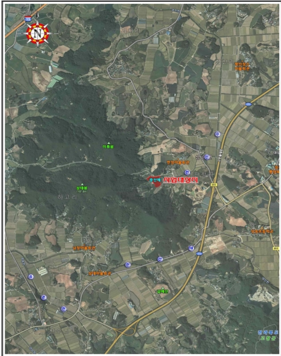
【붙임1 위치도】 전라북도 고창군 성송면 판정리 510-1번지 일원