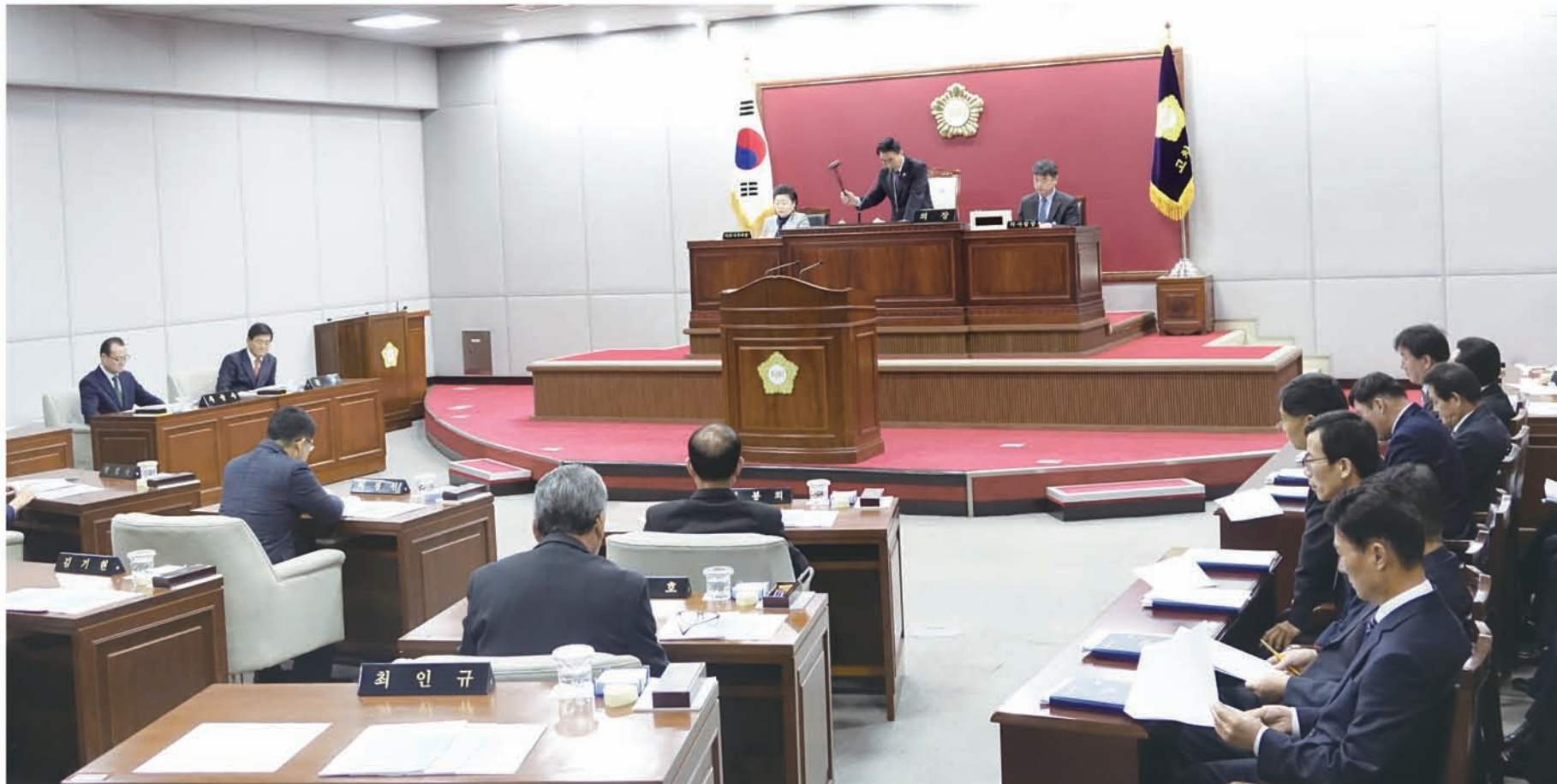
〈제242회 고창군의회 제2차 정례회 폐회〉

고창군의회(의장 최인규)는 올해 마지막 회기인 제242회 제2차 정례회를 지난 11월 15일부터 30일간 운영하고 12월 14일 폐회했다. 이번 정례회에서는 2016년도 행정사무감사, 2017년도 실과소별 시책보고, 군정질문과 답변