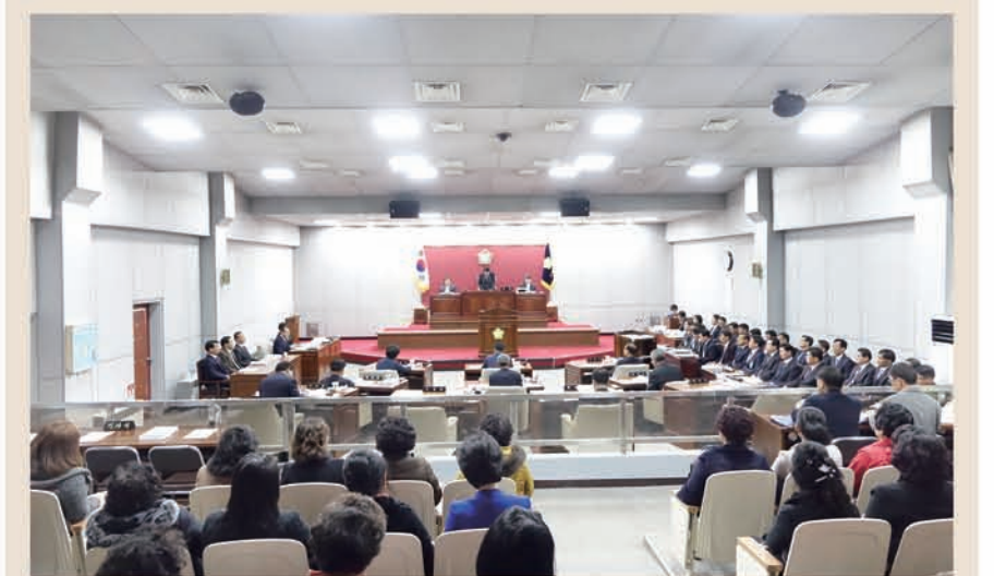
〈제242회 고창군의회 제2차 정례회 군민 방청〉

고창군의회 (의장 최인규)는 제242회 고창군의회 제2차 정례회를 맞아 11월 24일부터 12월 1일까지 5일 동안 250여명의 단체(주민)를 초청 방청하게 하였다. 주요 군정질문과 답변, 2017년도 실과소별 시책보고를 방청하면 서 군민과 의정활동을 함께 호흡하고, 군민 애로사항과 의견 청취를 맞아 11월 24일부터 12월 1일까지 5일 동안 250여명의 단체(주민)를 초청 방청하게 하였다. 주요 군정질문과 답변, 2017년도 실과소별 시책보고를 방청하면