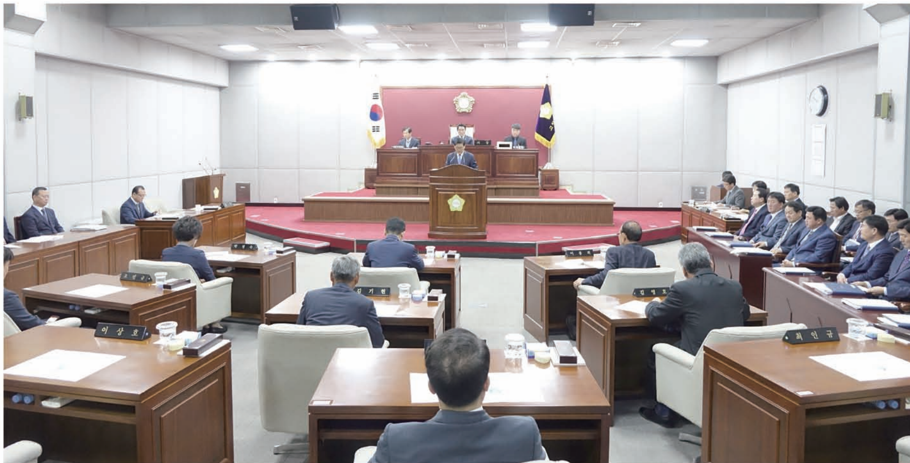
〈고창군의의회 제241회 임시회 본회의〉

고창군의의회(의장 최인규)는 2016. 10. 11(화)부터 21(금)까지 11일간의 회기일정으로 제241회 임시회를 개최하여 조례안 및 기타 안건 심의, 주요사업장 현장방문, 2016년도 제2회 추가경정 일반 및 특별회계 세입·세출안 심의, 2016년도 행정사무감사 계획 승인 등을 추진하였다. 이번 임시회에서는 국가유공자의 예우를 위한 이용료 면제 및 효율적인 운영을 위한 휴무일 및 휴장기간 개정을 위한 「고창군 작은목욕탕 관