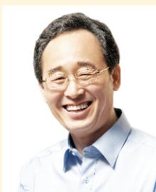
도지사 송 하 진