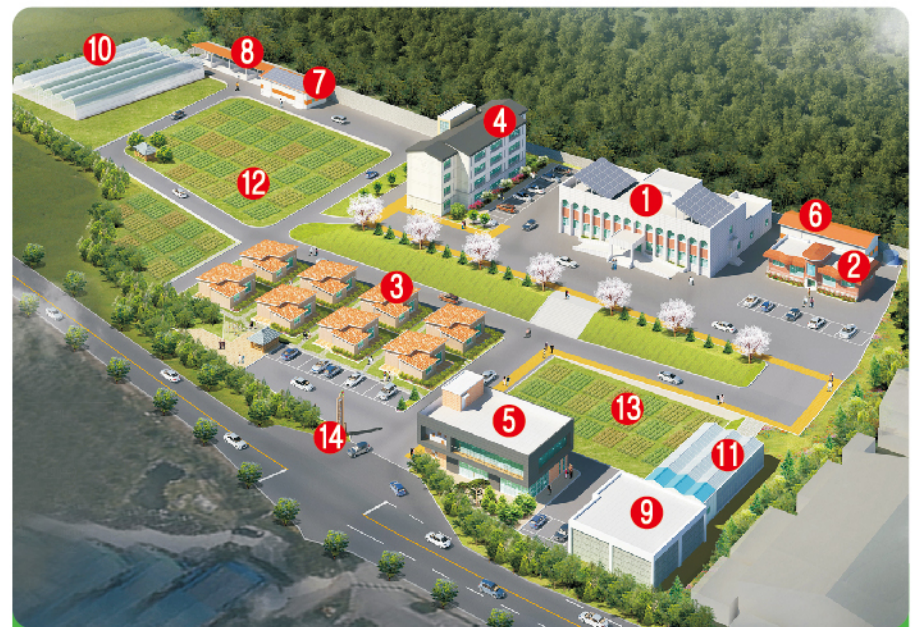
① 영농 교육관 ② 체류형주택2(단독) ③ 체류형주택1(단독) ④ 체류형주택(공동형) ⑤ 창업농교육관 ⑥ 창고(물탱크, 수배전반) ⑦ 농기계, 자재보관소 ⑧ 공동 퇴비장 ⑨ 저온저장고 ⑩ 공동체실습하우스 ⑪ 유리온실 ⑫ 세대별실습농장 ⑬ 단기농촌체험시설 조성예정부지 ⑭ 문주

올 3월 문을 연 체류형 농업창업지원센터는 모집세대 30세대 중 26세대가 입교하여 교육 중이며, 남은 4세대와 예비세대 6세대를 연중 지속적으로 모집하고 있다.