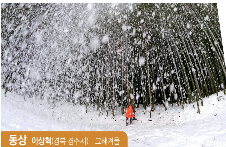
동상 이상혁(경북 경주시) - 그해겨울