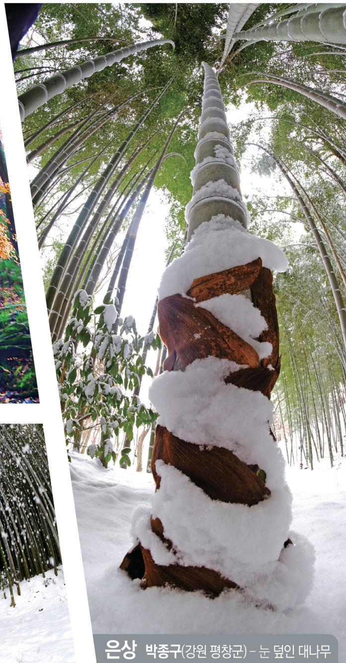
은상 박종구(강원 평창군) - 눈 덮인 대나무