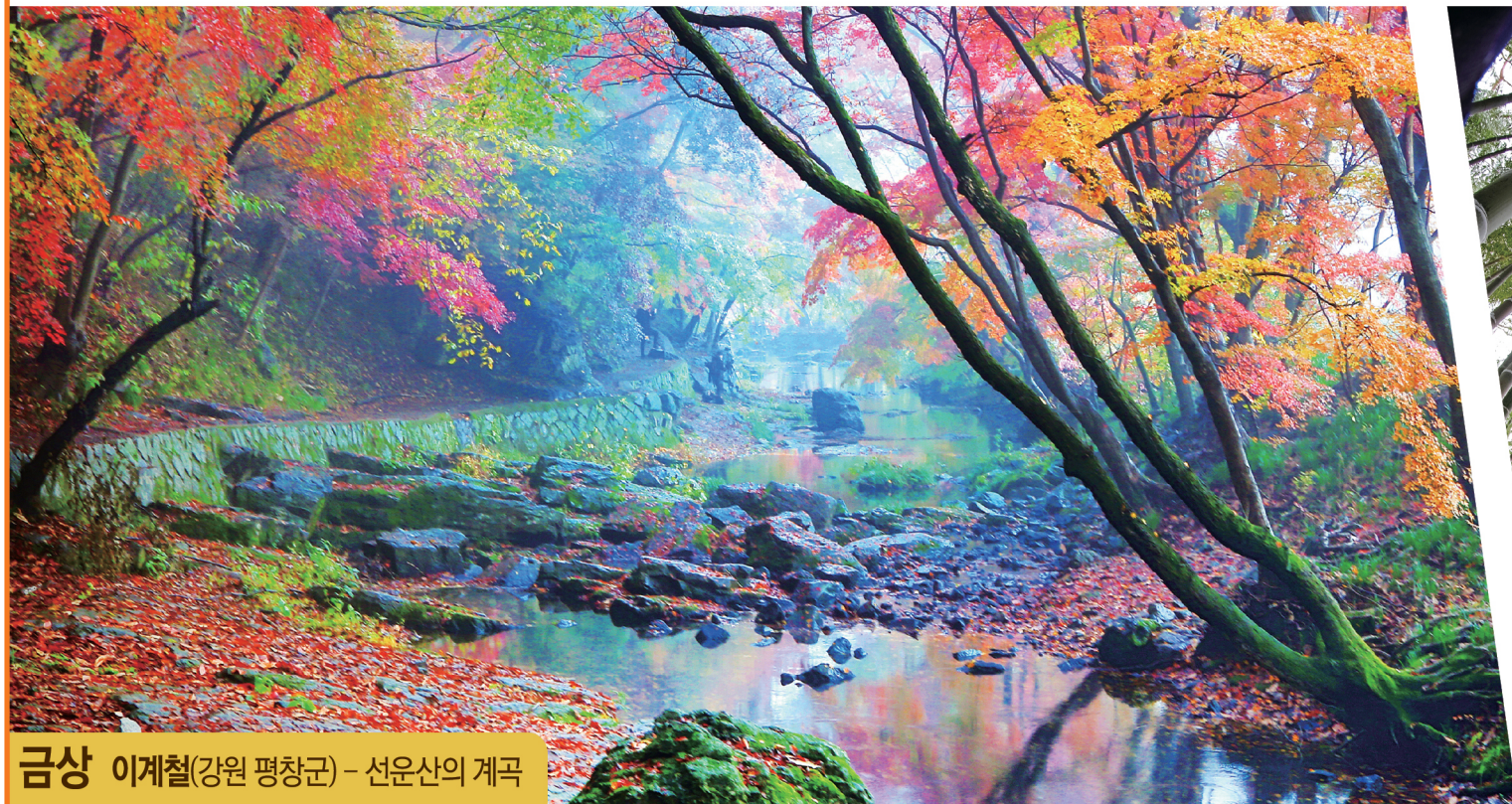
금상 이계철(강원 평창군) - 선운산의 계곡