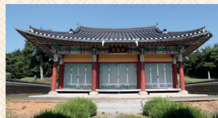
무송윤씨 시조를 모신 송양사(대산면 성남리)

윤소종(尹紹宗)은 1360년(공민왕 9) 뛰어난 성적으로 과거에 장원 급제해 사관(史官)이 되고 여러 관직을 거쳐 정언(正言, 종육품)에 임명됐다. 강개(慷慨)하고 큰 뜻이 있어 임금의 마음을 바로잡고 풍속을 바르게 하는 일을 자신의 임무로 삼았다. 늘 임금에게 정치의 잘잘못을 진술하는 데 숨김이 없었다. 이성계가 사전(私田)을 개혁하려 하자 거의 모든 조정 관리들이 반대했으나 윤소종이 정도전 등과 더불어 힘써 청하여 이를 개혁했다. 또 승려 찬영(燦英)을 왕사(王師)로 삼으려 하는 데 대한 윤소종의 불가 상소가 왕의 비위를 건드려 예조전서로 옮겼다가 금주(錦州)로 귀양 갔다. 집에 자주 양식이 떨어지는 지경에 이르렀어도 개의치 않고, 손에서 책을 놓지 않았다. 특히 성리학에 정통했고, 저술한 시문이 8권인데, 스스로 '동헌집(桐軒集)'이라 이름 붙였다. 아들은 세종 때 대제학을 지낸 윤희(尹淮)다.