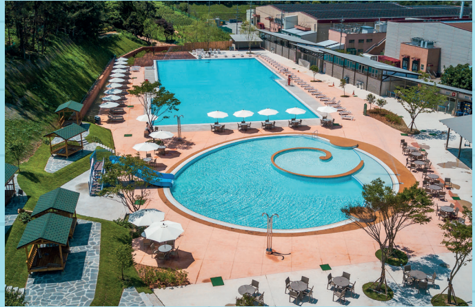
상하농원 파머스빌리지 야외수영장

지난 6월말 문을 연 상하농원 파머스빌리지 수영장은 독특한 컨셉의 유아풀과 50m의 대형풀을 가지고 있다. 달팽이 모형의 차별화된 유아풀은 안쪽으로 들어갈수록 서서히 낮아지는 구조로 기존풀과 차별화를 뒀다. 또 미끄럼틀 등 아이들의 흥미를 유발하고 다양한 물놀이를 즐길수 있도록 설계됐다. 대형풀은 50mx24m의 넓은 규모의 수영장으로 고객들이 한산하고 여유로운 수영을 즐길 수 있다. 특히 국제규격에 맞게 설계돼 인근 상하초등학교 아이들이 주중 시간을 활용해 수영연습을 하고 있다.