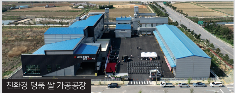
친환경 명품 쌀 가공공장

고창황토배기청정고구마연합 영농조합법인은 '고창 고구마 가공공장 준공식'을 열었다. 고구마 가공공장은 고구마 가공시설(2515㎡)과 홍보실 및 사무실(808㎡)을 갖췄다. 지역 고구마 생산량의 25%를 차지하는 비선회품을 수매 가공해 추가소득 창출이 예상된다. 특히 관내 500여호의 소규모 고구마 농가의 소득 향상은 물론 지역경제 활성화도 기대된다.