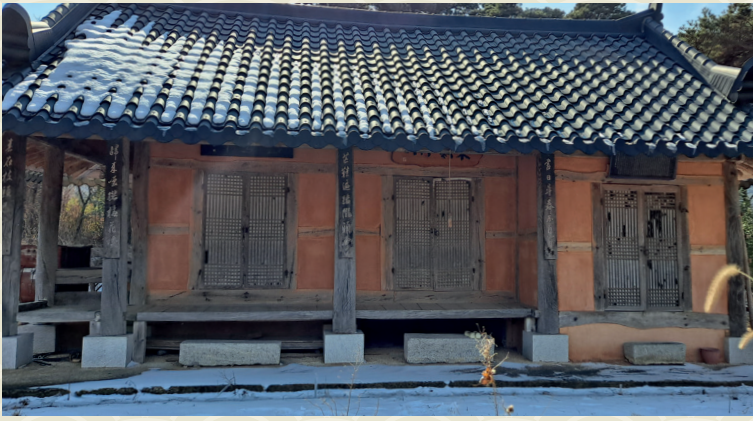
동오정사 위치 : 고창읍 월산리 497

조의곤(曹毅坤1832~1893)은 고창읍 월암리에서 태어났으며, 호(號)는 동오(東塢)이다. 기정진(奇正鎭 1798~1876)에게 성리학을 배웠으며 과거에 뜻을 두지 않고 학문연구에 전념하였으며 특히 경학에 조예가 깊었다. 1876년 고향으로 귀향하여 마을의 동쪽 언덕 위에 동오정을 지었다. 당시 주변의 유림과 제자들 뿐만 아니라 타성의 문중에서도 십시일반으로 성금을 거두어 정자를 지었다. 그곳에서 후진을 양성하고 학자들과 학문을 강론했다. 동오정은 대원군이 현판을 써준 정자로도 유명하다. 동오정은 동오정사라고도 불렀는데 원래는 고창군 고창읍 석정리에 세워졌다. 현재 위치해 있는 월산리는 최근에 옮겨진 것이다. 저서로 시문집『동오유고(東塢遺稿)』가 있다. 이 시문집은 목활자본으로 1899년에 제작되었는데 아들 조석휴가 발간한 것이다.