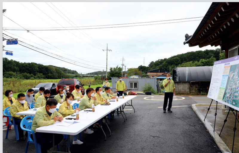
제283회 임시회 주요사업장 현장방문