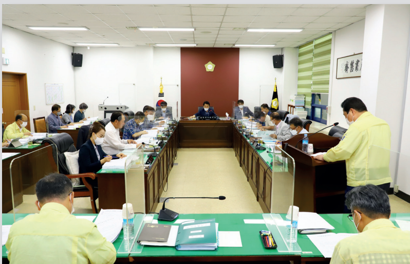
제282회 임시회 주요업무 추진상황 보고