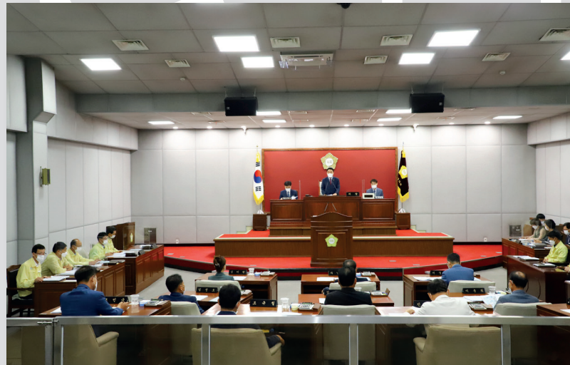
제283회 임시회 개회