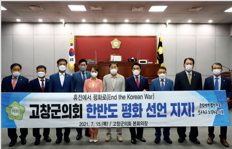
고창군의회 한반도 평화 선언 지지