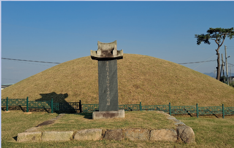
📍 남당희맹단 위치 : 전라북도 고창군 흥덕면 용반리

채홍국(1534~1597)은 조선 중기 의병으로, 호는 야수(野搜)이다. 어려서부터 효성으로 부모를 섬겨 향리와 집안 어른들의 칭송을 받았다.