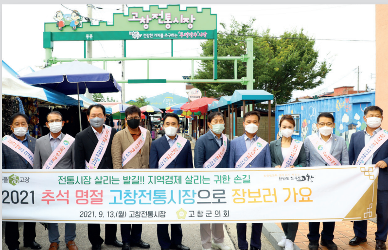
2021년 추석맞이 전통시장 장보기