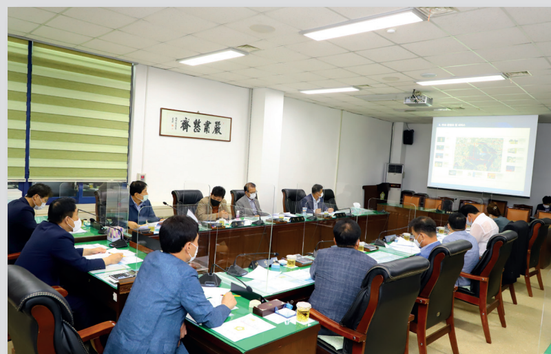
9월 의원 간담회(현안업무 청취)