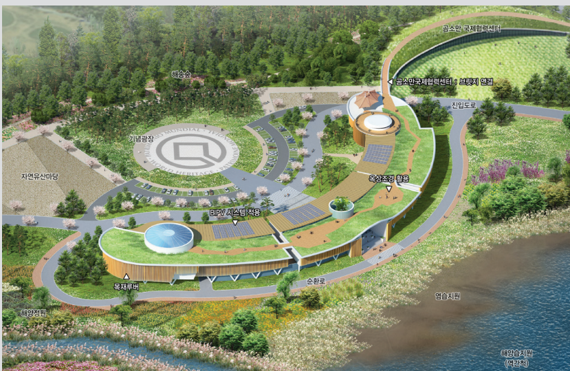
▲ 고창갯벌 세계유산지역센터 조감도

해양수산부가 2024년 새해 예산안 설명을 통해 고창갯벌에 세계유산지역센터를 짓기로 하면서 고창군 수협과 심원면민 등 지역주민들이 환영과 기대감을 드러냈다. 해양수산부는 2026년까지 심원면 만돌리 일원에 세계유산지역센터를 짓고, 세계자연유산 전시·홍보·교육과 체계적인 연구를 위한 장소로 활용할 예정이다. 이와관련 고창군 수산업협동조합 김충 조합장은 “국내 생산량의 절반을 차지하는 바지락을 비롯해 지주식 김 등 갯벌이 가진 생태와 주민들의 고유한 문화를 한 곳에서 체험할 수 있는 곳은 오직 고창 뿐이다”며 “관련 절차가 원활히 추진될 수 있도록 힘껏 돕겠다”고 밝혔다.