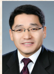
이경신 부의장 (고창, 고수, 신림)

희망찬 2024년 새해가 밝았습니다. 지난 한 해 동안 아낌없는 지지와 성원을 보내주신 군민 여러분께 깊은 감사의 말씀을 드리며, 새해에도 변함없는 애정과 격려를 보내주시기를 기대합니다. 저는 취임 당시의 초심을 끝까지 잊지 않고 군민과의 소중한 약속을 반드시 지키겠다고 다짐하며 새해를 시작하겠습니다. ‘큰 희망이 큰 사람을 만든다’는 말처럼, 올 한해도 나보다는 우리를, 그리고 지역을 위해 큰 희망을 가슴에 품고, 최선을 다하면서 군민들에게 꿈과 행복을 선사하는 의원이 될 수 있도록 초지일관으로 정진하겠습니다. 새해 복 많이 받으십시오! 감사합니다.