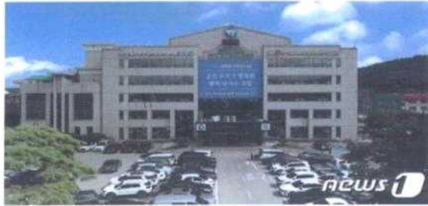
전북 고창군청 정사 전경

전북 고창군이 일상생활 속 불편규제, 기업규제 등 개선으로 군민의 불편을 해소하고 지역경제를 활성화 하기 위해 규제개혁을 추진한다고 30일 밝혔다.