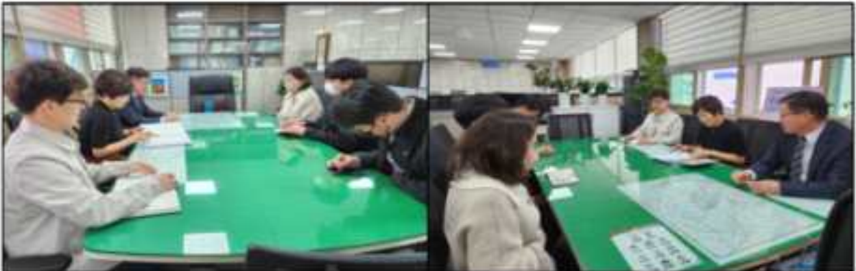
합천군청 기획예산실 법무규제팀 방문