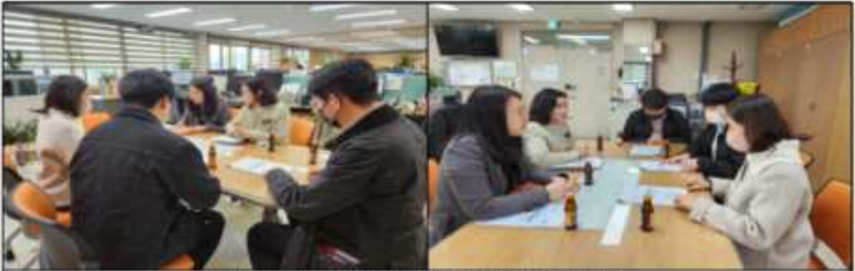
통영시청 기획예산실 법무규제개혁팀 방문