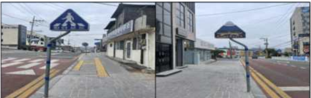
(앞쪽) 합천군 굴곡형 안전표지판 우수사례 (뒷쪽)