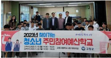
고창군, '찾아가는 청소년 주민참여예산학교' 개최

고창군이 지역 청소년을 대상으로 한 2023년 고창군 찾아가는 청소년 주민참여예산학교를 두차례에 걸쳐 실시했다고 24일 밝혔다.