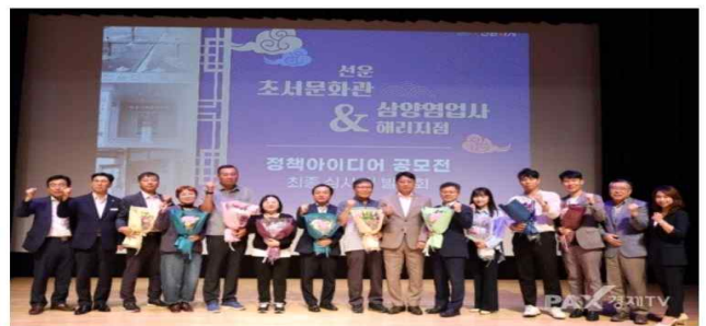
고창군이 지난 19일 115건에 대해 제안심사 실무위원회를 거쳐 군민제안 6건과 공무원제안 6건을 합한 최종 12건을 선정 시상식을 개최했다.

심 군수 “우수한 제안들을 참고, 군민들에게 좋은 방향으로 활용될 수 있도록 고려하겠다.”