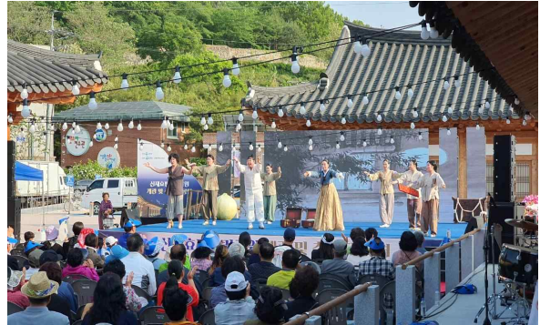
신재효판소리공원 프로그램 운영(판소리 산 공부)